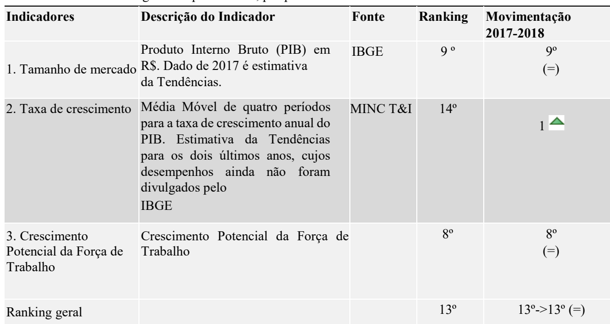
Tabela 8 – Goiás: Ranking da competitividade, por pilar Potencial de Mercado – 2018.

Fonte: Ranking da competitividade dos Estados/CPL (2018).