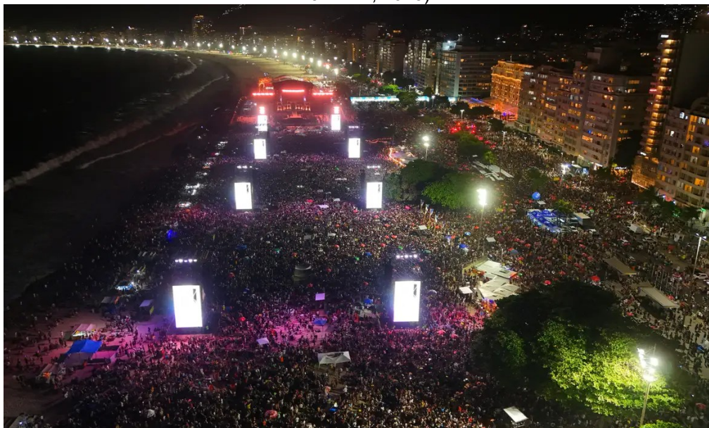
Figura 1 – Vista aérea do público e da estrutura do show de Lady Gaga na Praia de Copacabana (Rio de Janeiro, 2025).