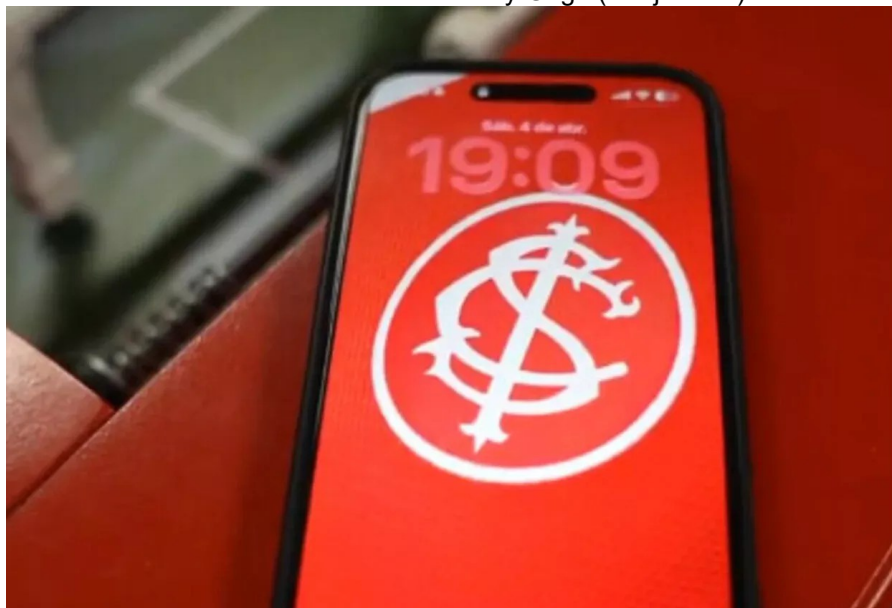
Figura 2 – Frame do vídeo de anúncio da contratação de Alerrandro pelo Sport Club Internacional, com referência musical a Lady Gaga (“Alejandro”).